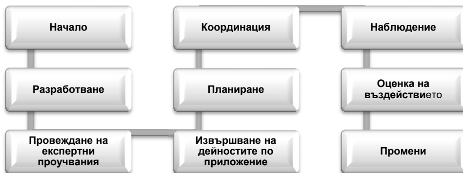
Процес на прилагане на електронната демокрация